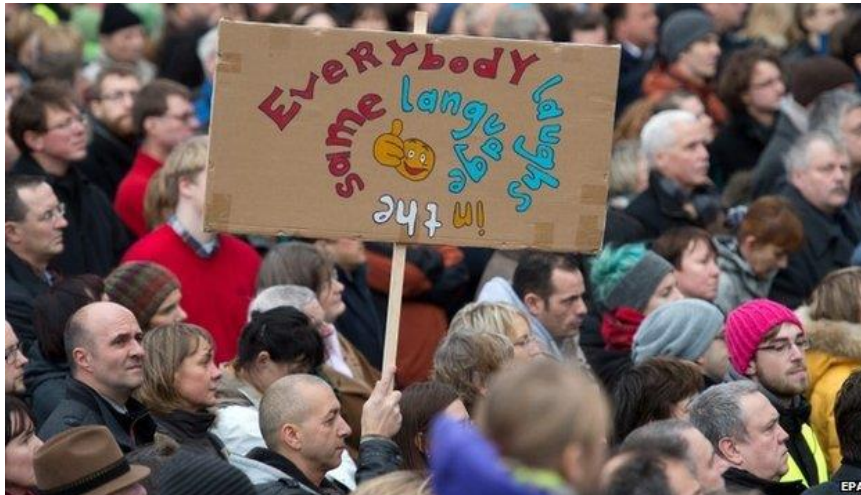
demo for "cultural openness, humanity and dialogue" in Dresden, 10 January 2015

Interkulturelle und generationen- übergreifende Reflexionen über Familie, Fremdsein und die Gestaltung der Zukunft Workshop